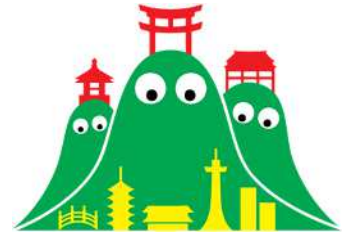
マスコットキャラクター 「京だらぼっち」