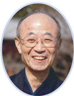
宗教学者 山折 哲雄 氏